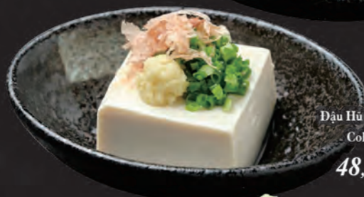
冷奴 Đậu Hũ Cá Bào Cold Tofu 48,000 đ