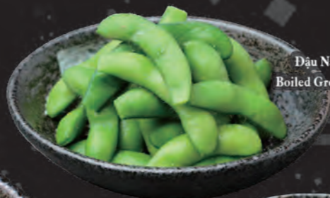
枝豆 Đậu Nành Nhật Bản Boiled Green Soybeans 48,000 đ