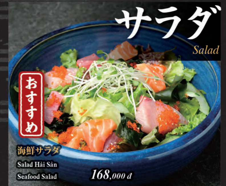
おすすめ 海鮮サラダ Salad Hải Sản Seafood Salad 168,000 đ