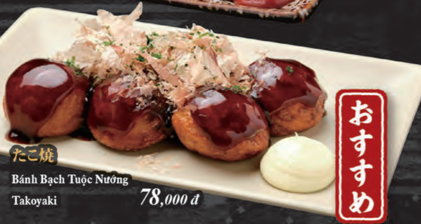
たこ焼 Bánh Bạch Tuộc Nướng Takoyaki 78,000 đ