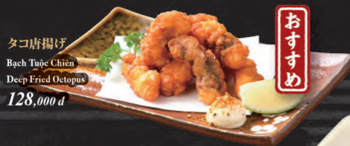
タコ唐揚げ Bạch Tuộc Chiên Deep Fried Octopus 128,000 đ