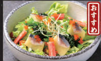
おすすめ 子持ちニシンと 海藻のヘルシーサラダ Salad Rong Biển & Cá Trích Ấp Trứng Seaweed & Egg Bearing Herring Salad 158,000 đ