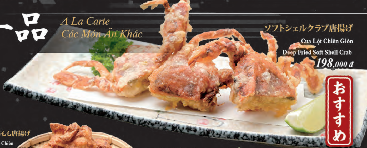
ソフトシェルクラブ唐揚げ Cua Lột Chiên Giòn Deep Fried Soft Shell Crab 198,000 đ