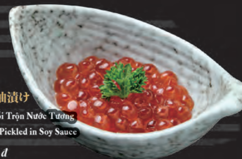
いくら醤油漬け Trứng Cá Hồi Trộn Nước Tương Salmon Roe Pickled in Soy Sauce 188,000 đ