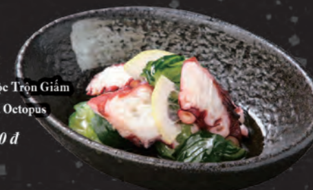
タコ酢 Bạch Tuộc Trộn Giấm Vingared Octopus 98,000 đ