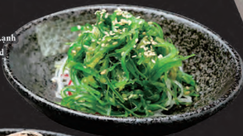
冷やしワカメ Rong Biển Tươi Lạnh Seasoned Seaweed 48,000 đ