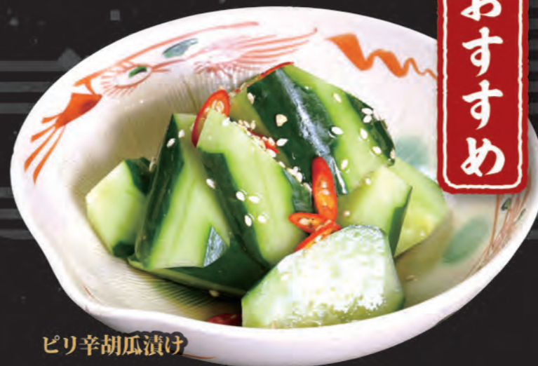
ピリ辛胡瓜漬け Đưa Leo Muối Vị Cay Spicy Pickled Cucumber 55,000 đ