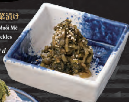
胡麻高菜漬け Cải Xanh Muối Mè Takana Pickles 48,000 đ