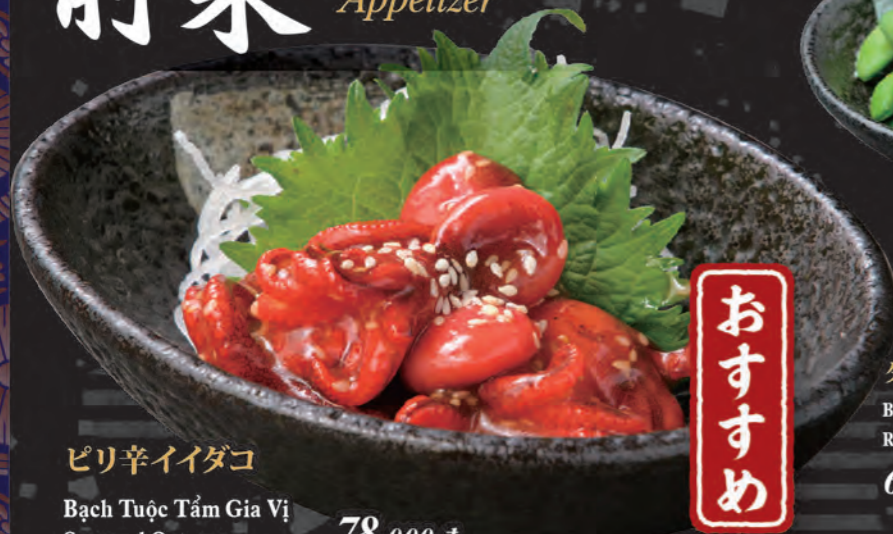
ピリ辛イダコ Bạch Tuộc Tẩm Gia Vị Seasoned Octopus 78,000 đ