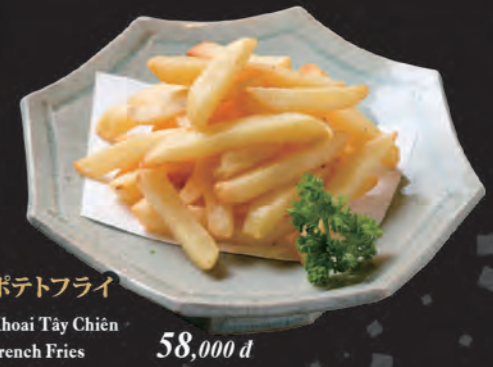
ポテトフライ Khoai Tây Chiên French Fries 58,000 đ