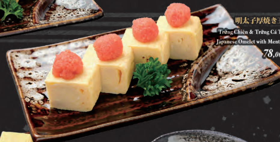
明太子厚焼き玉子 Trứng Chiên & Trứng Cá Tuyền Japanese Omelet with Mentaiko 78,000 đ