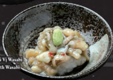
タコわさび Bạch Tuộc Muối Vị Wasabi Raw Octopus with Wasabi 68,000 đ