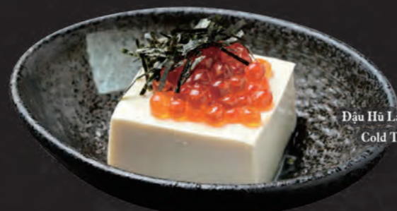
いくら冷奴 Đậu Hũ Lạnh & Trứng Cá Hồi Cold Tofu with Salmon Roe 88,000 đ