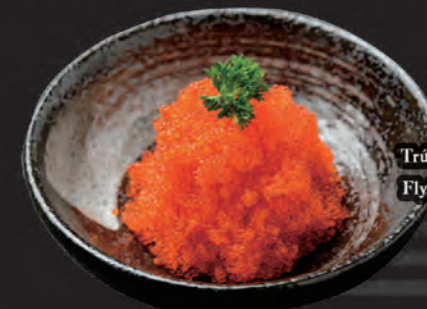
とび子 Trứng Cá Chuồn Flying Fish Roe 98,000 đ