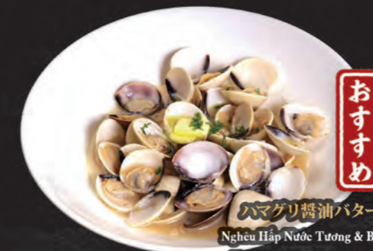
おすすめ ハマグリ醤油バター Nghêu Hấp Nước Tương & Bơ Hard Clam Soy Sauce Butter 118,000 đ