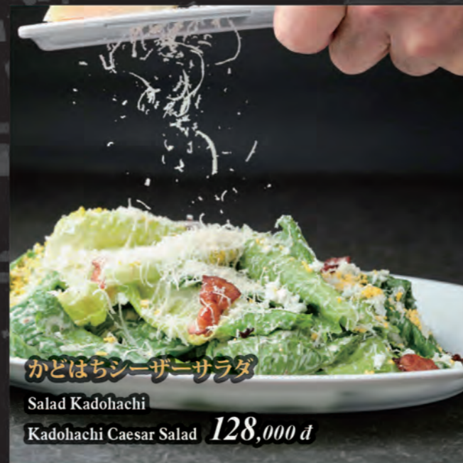
かどはちシーザーサラダ Salad Kadohachi Kadohachi Caesar Salad 128,000 đ