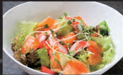
サーモンサラダ Salad Cá hồi Salmon Salad 158,000 đ