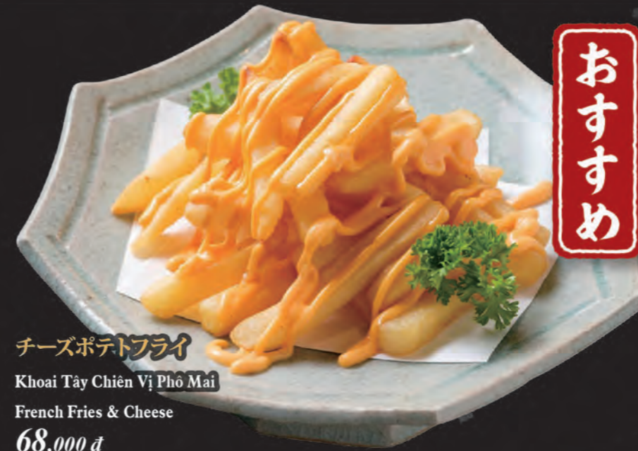
チーズポテトフライ Khoai Tây Chiên Vị Phô Mai French Fries & Cheese 68,000 đ