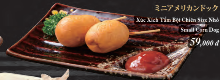
ミニアメリカンドック Xúc Xích Tầm Bột Chiên Size Nhỏ Small Corn Dog 59,000 đ