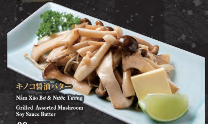
キノコ醤油バター Nấm Xào Bơ & Nước Tương Grilled Assorted Mushroom Soy Sauce Butter 89,000 đ