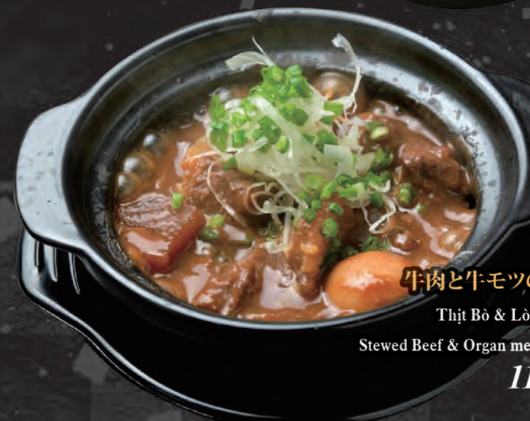
牛肉と牛モツのどて煮 Thịt Bò & Lòng Bò Hầm Stewed Beef & Organ meat Tendons 118,000 đ