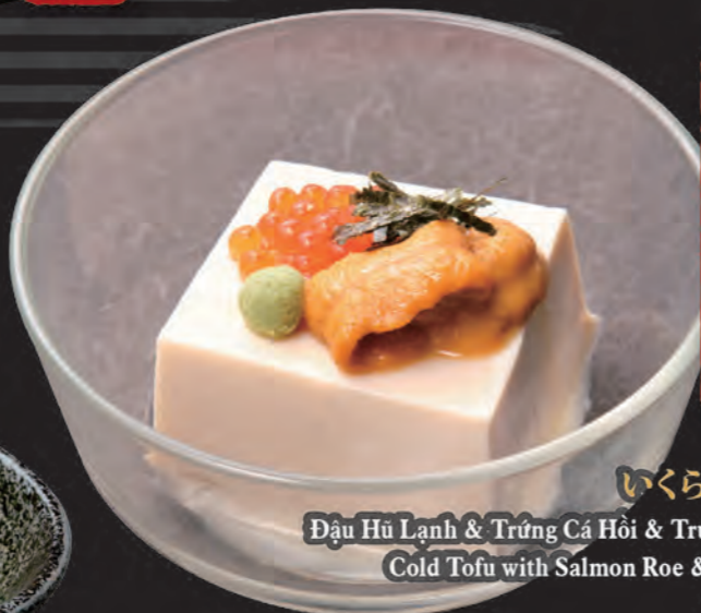
いくらウニ冷奴 Đậu Hũ Lạnh & Trứng Cá Hồi & Trứng Cầu Gai Cold Tofu with Salmon Roe & Sea Urchin 98,000 đ