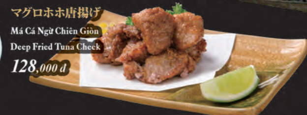
マゲロホホ唐揚げ Má Cá Ngừ Chiên Giòn Deep Fried Tuna Cheek 128,000 đ