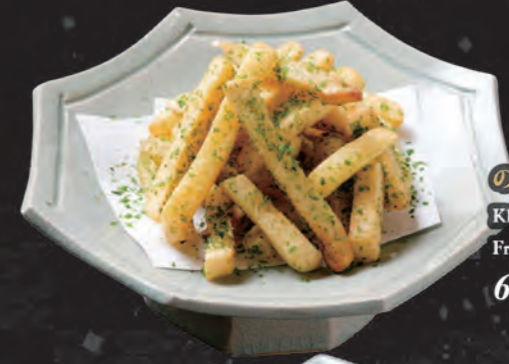
のり塩ポテトフライ Khoai Tây Chiên Vị Rong Biển French Fries & Seaweed Flavour 68,000 đ