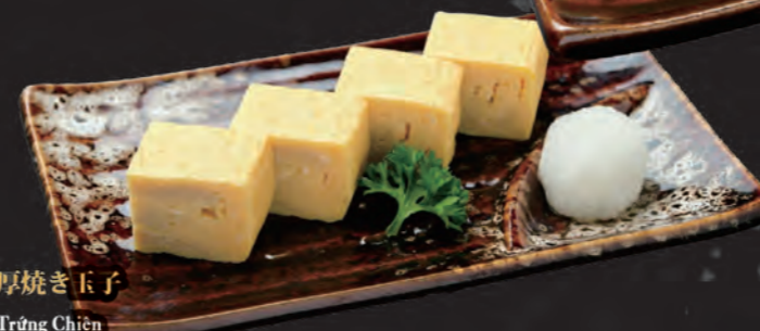
厚焼き玉子 Trứng Chiên Japanese Omelet 58,000 đ