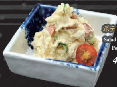
ポテトサラダ Salad Khoai Tây Potato Salad 48,000 đ