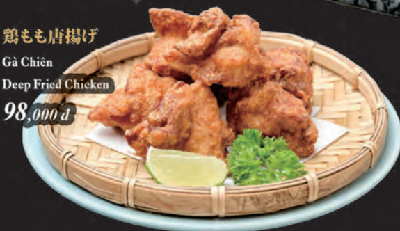
鶏もも唐揚げ Gà Chiên Deep Fried Chicken 98,000 đ