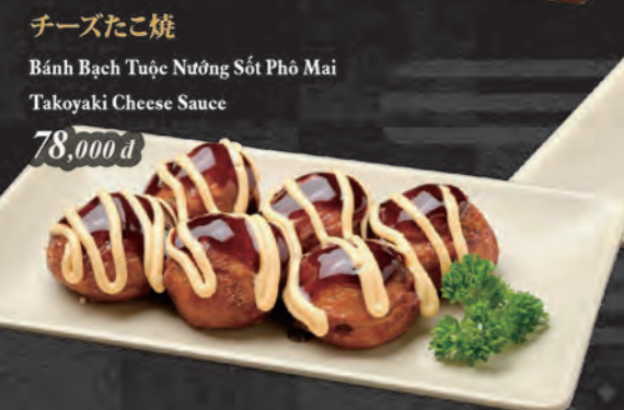
チーズたこ焼 Bánh Bạch Tuộc Nướng Sốt Phô Mai Takoyaki Cheese Sauce 78,000 đ