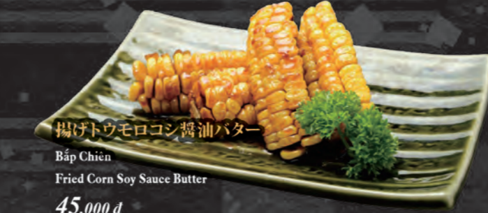
揚げトウモロコシ醤油バター Bắp Chiên Fried Corn Soy Sauce Butter 45,000 đ