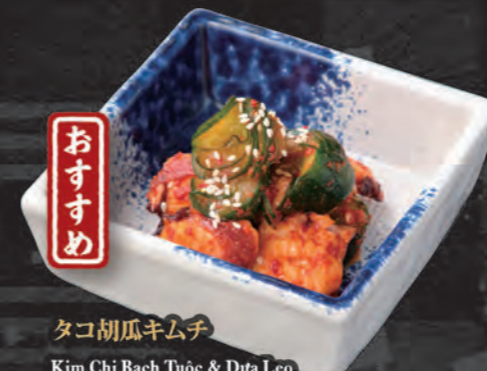
タコ胡瓜キムチ Kim Chi Bạch Tuộc & Đưa Leo Octopus Cucumber Kimuchi 98,000 đ