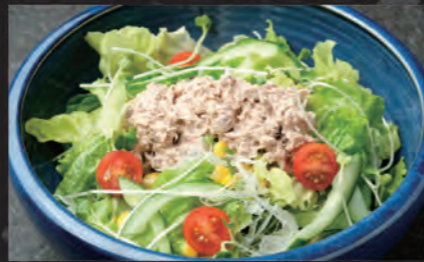
ツナグリーンサラダ Salad Cá Ngừ Green Salad with Tuna 128,000 đ