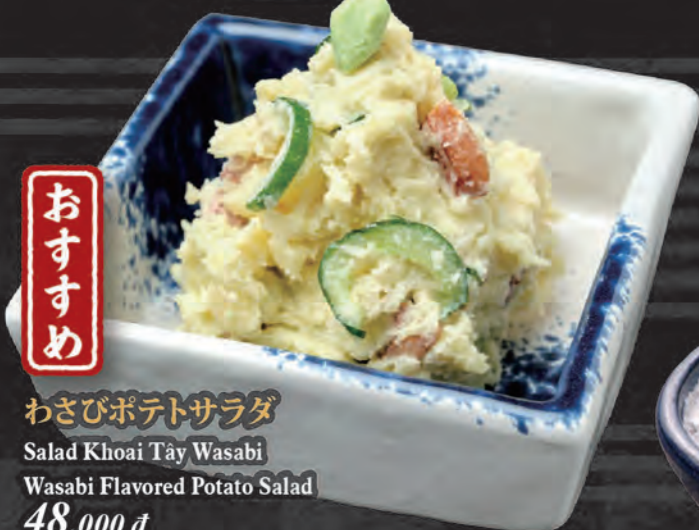
わさびポテトサラダ Salad Khoai Tây Wasabi Wasabi Flavored Potato Salad 48,000 đ