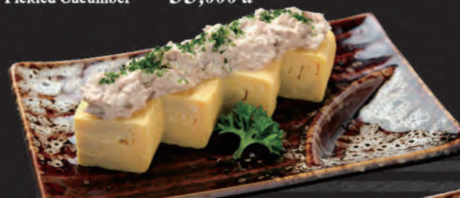
ツナマヨ厚焼き玉子 Trứng Chiên & Cá Ngừ Mayonnaise Japanese Omelet with Tuna & Mayonnaise 68,000 đ