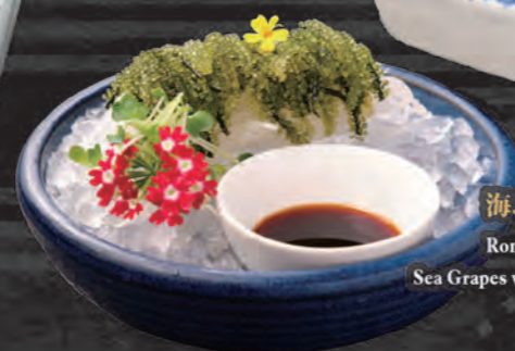
海ぶどうポン酢 Rong Nho Sốt Ponzu Sea Grapes with Ponzu Sauce 58,000 đ