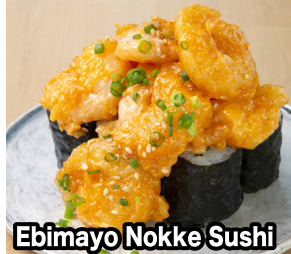
Ebimayo Nokke Sushi