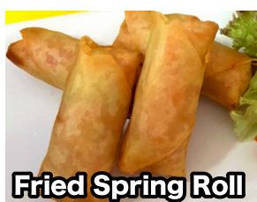
Fried Spring Roll