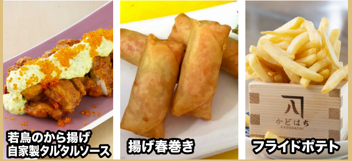
若鳥のから揚げ 自家製タルタルソース 揚げ春巻き フライドポテト