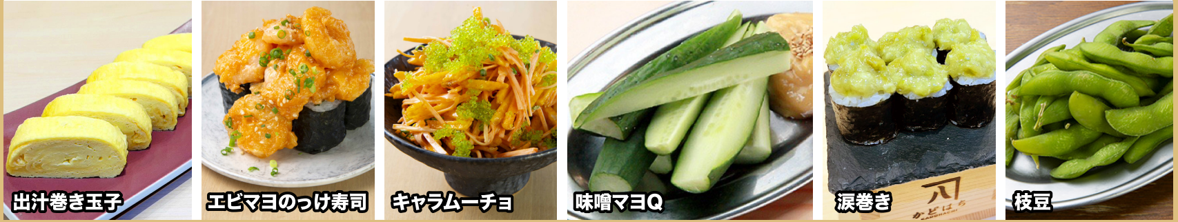
出汁巻き玉子 エビマヨのつけ寿司 キャラムーチョ 味噌マヨQ 涙巻き 枝豆