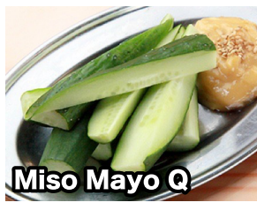
Miso Mayo Q