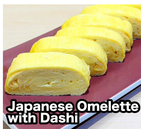
Japanese Omelette with Dashi